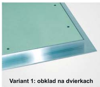
Variant 1: obklad na dvierkach