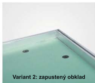
Variant 2: zapustený obklad