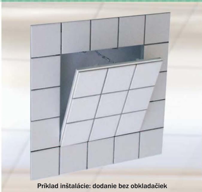
Príklad inštalácie: dodanie bez obkladačiek