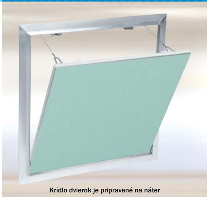
Krídlo dvierok je pripravené na náter