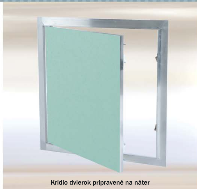
Krídlo dveriek pripravené na náter

Medzi rámom a krídlom dveriek je vzduchová medzera 1,5 mm. Dverka sa otvárajú stlačením ukrytých zacvakávacích zámkov.