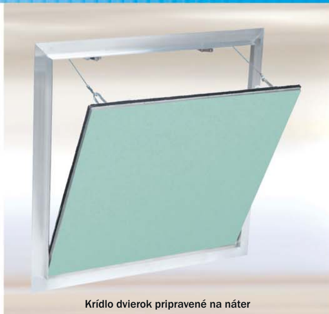
Krídlo dvierok pripravené na náter