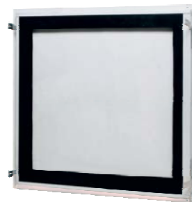
skúšané do rozmeru 600 x 600 mm

Teraz tiež vo verzii "vzducho a prachotesné" a tiež v nerezovom prevedení