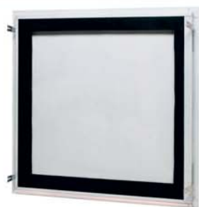
skúšané do rozmeru 600 x 600 mm

Teraz tiež byť verzii " vzducho a prachotesné " a tiež v nerezovom vyhotovení